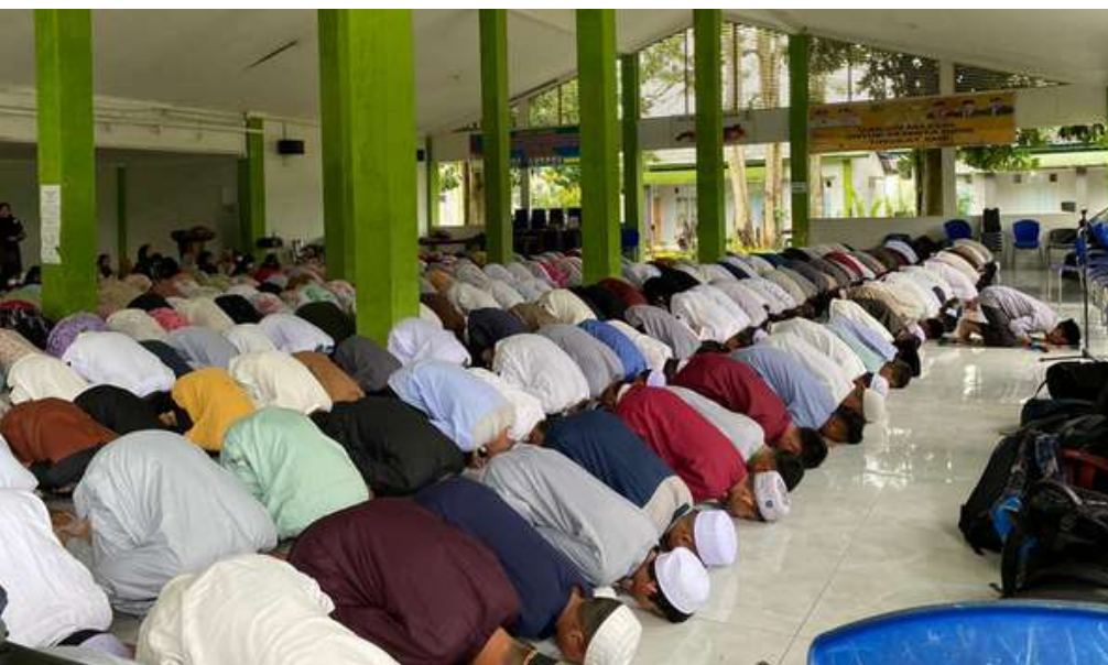
PESERTA DIDIK LAKSANAKAN SHOLAT DHUHA DAN SHOLAT DZUHUR DI SEKOLAH

Pendidikan karakter religius melalui pembiasaan shalat dzuhur berjemaah tersebut tidak hanya pada kegiatan shalat dzuhur berjemaah saja, namun dimulai ketika siswa mengantri wudhu, berbaris sebelum melaksanakan shalat dzuhur berjemaah, hingga ketika selesai shalat dzuhur berjemaah. Beberapa nilai-nilai karakter religius, antara lain disiplin melaksanakan shalat di awal waktu, menjalin ukhuwah dengan sesama, dan segala perilaku yang mencerminkan nilai-nilai religius seperti jujur, santun, percaya diri dan bergaya hidup sehat.