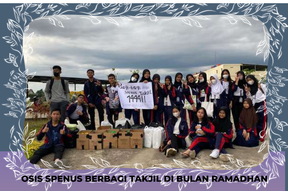
OSIS SPENUS BERBAGI TAKJIL DI BULAN RAMADHAN