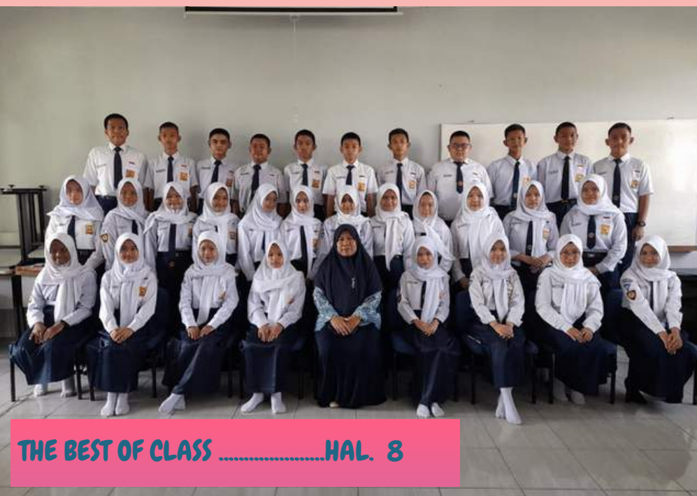
THE BEST OF CLASS .....HAL. 8

Buletin Spenus atau Elektronik Buletin (E-Buletin) edisi V bulan Februari yang berisi informasi mengenai kegiatan sekolah yaitu mengenal lebih dekat manajemen kesiswaan, Kunjungan ke Museum Pengulu Muhammad Soleh, Kegiatan PIK-R, Pelaksanaan rapat koordinasi bersama, Hasil tulisan tim ekskul jurnalistik Spenus yakni Ekspen, Zona informatif, The best of Class dan cerita humor:Tawa dulu dikupas dalam buletin edisi V ini . E- Buletin ini dipublikasikan secara teratur perbulan melalui Website, Whatsapp Grup, Facebook, dan Instagram