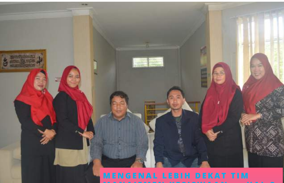
MENGENAL LEBIH DEKAT TIM MANAJEMEN KESISWAAN.....HAL 3