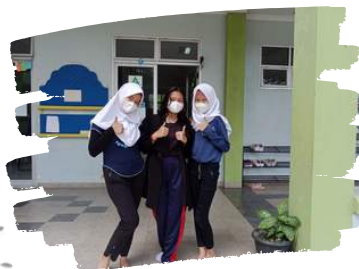
Tim zona informatif