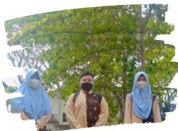
Tim tawa dulu