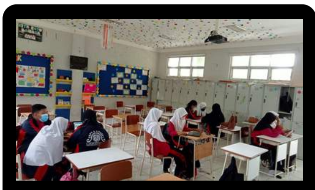
TIM EXPEN JURNALISTIK

Ekstrakurikuler Jurnalistik bertujuan untuk mempublikasikan berita mengenai kegiatan sekolah yang dibuat dalam bentuk buletin. Maka dari itu dibentuklah kelompok-kelompok jurnalistik untuk meliput kegiatan sekolah ataupun informasi umum lainnya. Hal ini merupakan upaya pensiasatan untuk kalangan siswa mengisi waktu senggangnya selepas kegiatan pendidikan wajib di sekolah