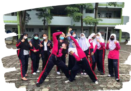
poto bersama tim jurnalistik