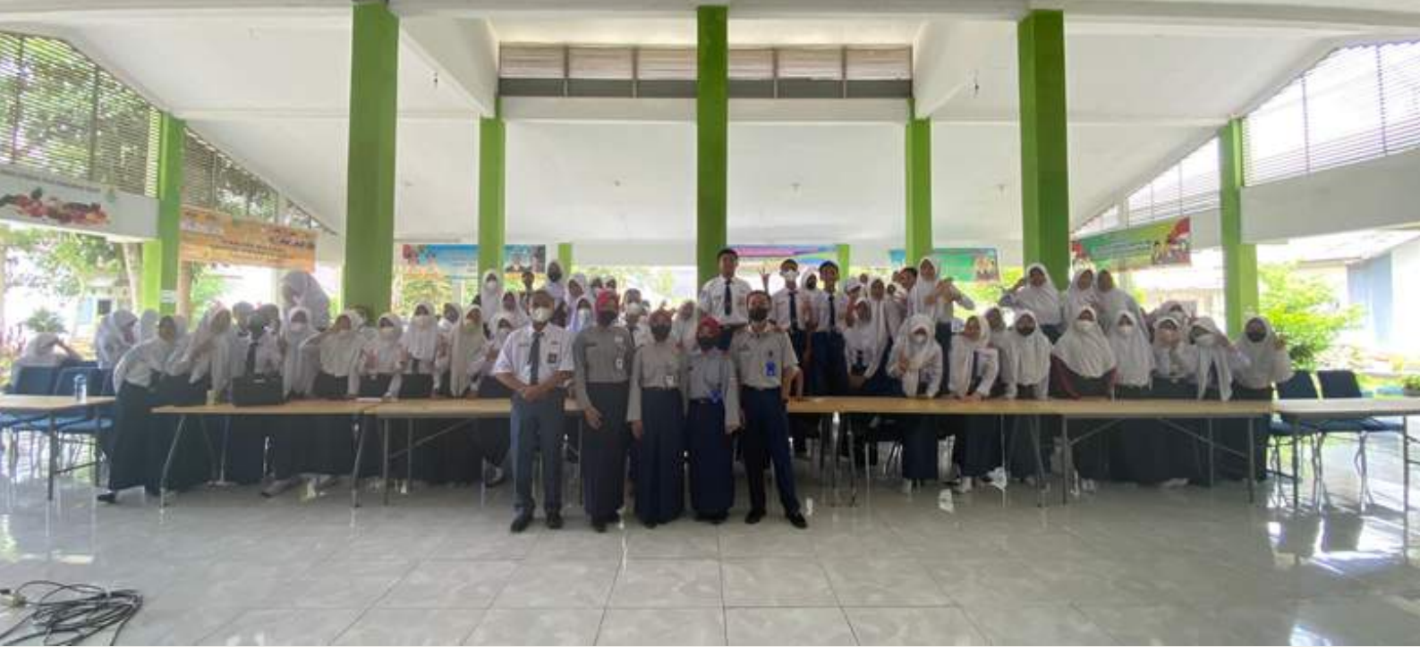
FOTO KEBERSAMAAN PESERTA DIDIK KELAS IX SMPN 6 UNGGUL SEKAYU DENGAN PARA ALUMNI YANG BERSEKOLAH DI SMAN SUMATERA SELATAN