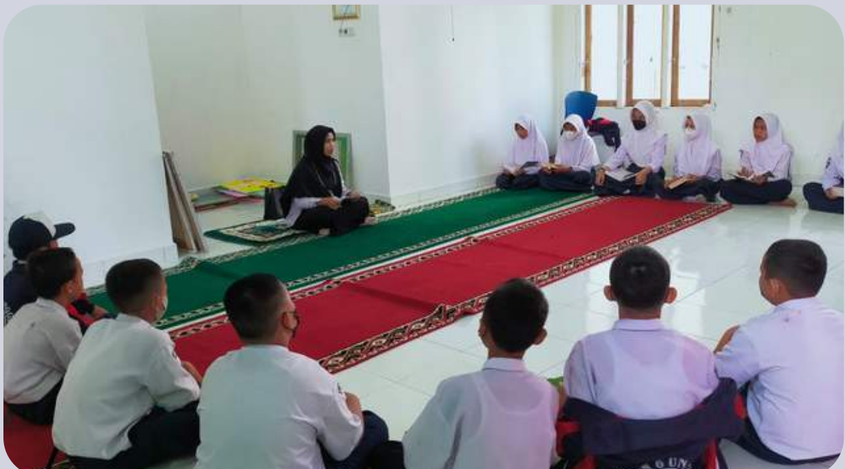
Kegiatan eskul Tahfidz di Mushola Al Amanah SMPN 6 Unggul Sekayu