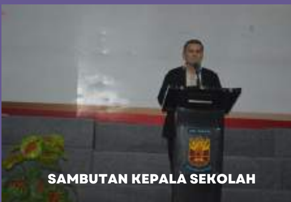
SAMBUTAN KEPALA SEKOLAH