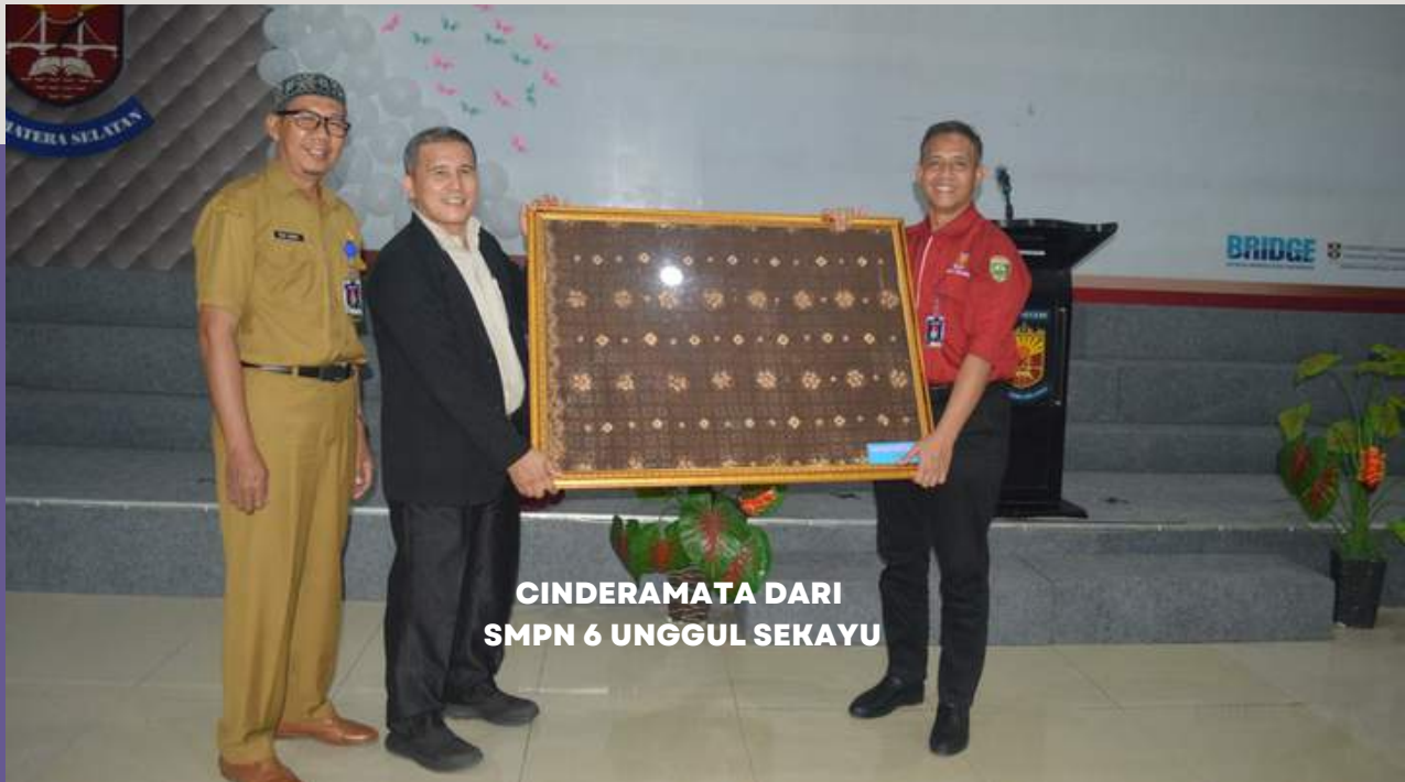
CINDERAMATA DARI SMPN 6 UNGGUL SEKAYU