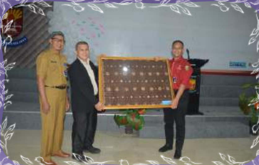
PENYERAHAN CINDERAMATA KE SMAN SUMATERA SELATAN