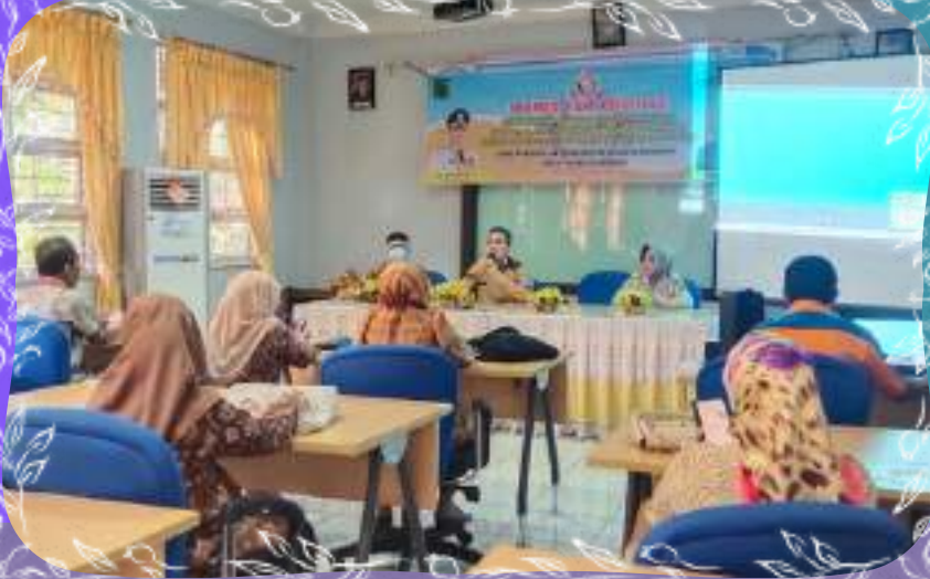
RAPAT BERSAMA KOMITE DALAM MEMBAHAS PERPISAHAN KELAS IX