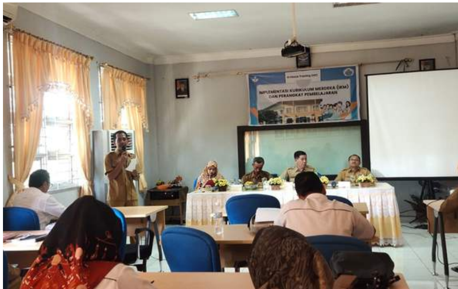
RAPAT PEMBINAAN DINAS PENDIDIKAN DAN KEBUDAYAAN KAB.MUSI BANYUASIN