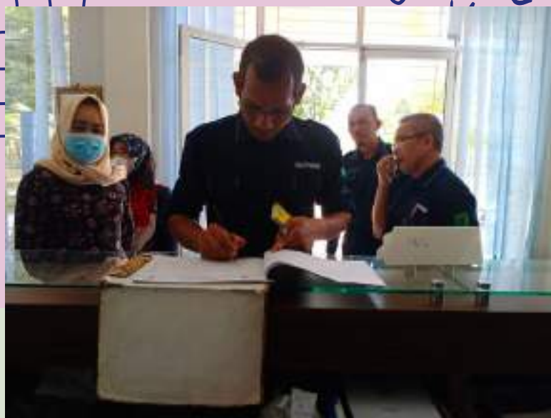
Tamu dari BPKSDM terkait penyelenggaraan kegiatan PPPK