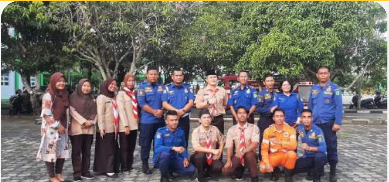
Kerjasama dengan Pihak Damkar Musi Banyuasin