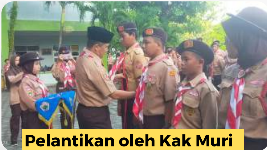
Pelantikan oleh Kak Muri

#Buletin_Spenus, Sedikitnya ada 300 lebih Peserta didik yang berlatih di Gudep Muba 02-141 & 02-142 Pangkalan SMPN 6 Unggul Sekayu dilantik menjadi Penggalang Ramu, Penggalang Rakit, Penggalang Terap dan Pemberian TKK Pramuka Penggalang.