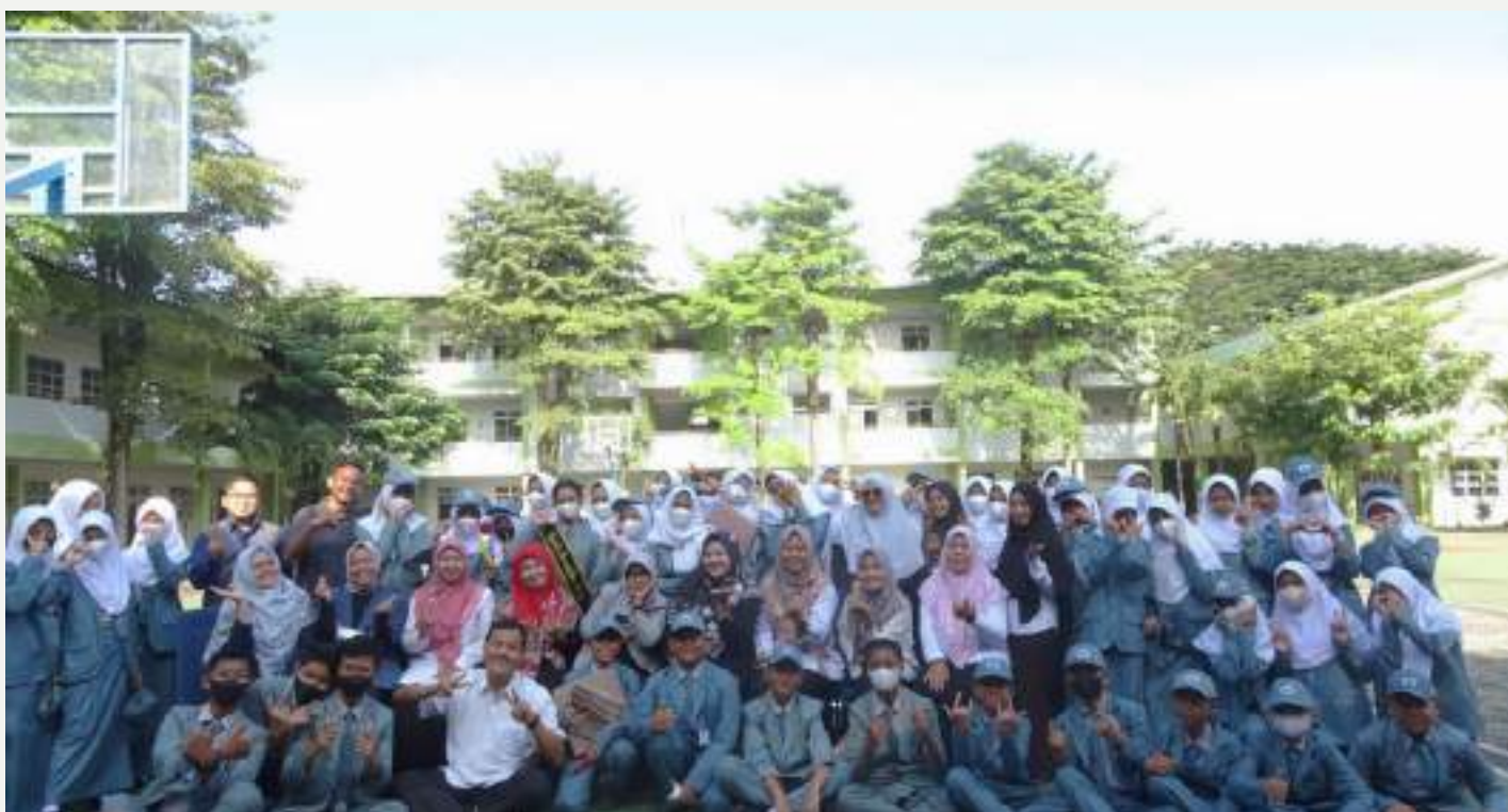
Foto bersama pengurus OSIS, Pengurus Rohis, Kepala Sekolah, Bapak Ibu Guru dan Pegawai SMPN 6 Unggul Sekayu