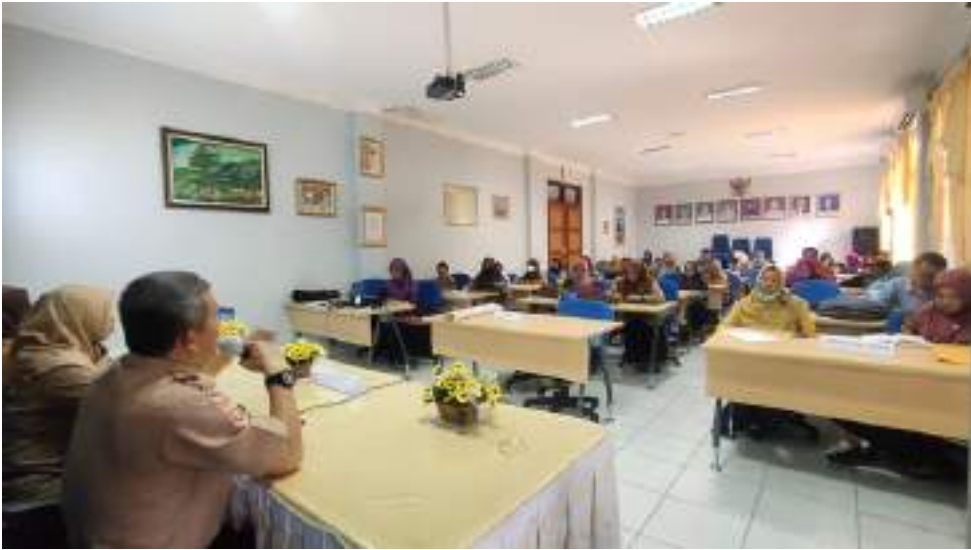
MENDAPAT DUKUNGAN POSITIF DALAM MENJALANI KEGIATAN PENDIDIKAN GURU PENGGERAK