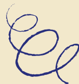
Tamu dari Banwaslu terkait penyelenggaraan kegiatan pemilihan umum

#Buletin_Spenus, Garda terdepan penerimaan tamu di sekolah adalah bagian Humas. Alur penerimaan sudah sesuai prosedur yakni dimulai dari Satpam yang menanyakan kepentingan tamu kemudian diarahkan ke resepsionis. Di bagian resepsionis tamu dimohon mengisi buku tamu dan ditanyakan maksud kedatangannya, setelah itu oleh Resepsionis diarahkan ke Waka Humas dan bagian manajemen lainnya sesuai kepentingan tamu yang datang.