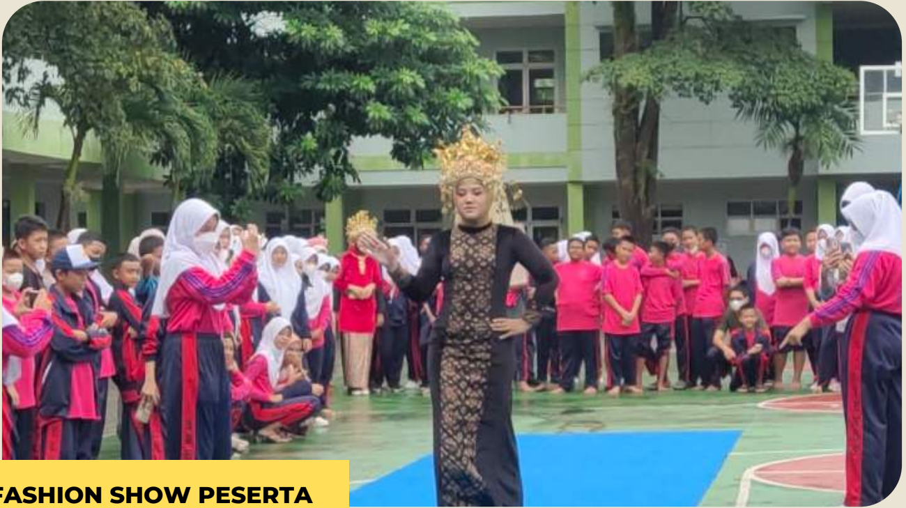
FASHION SHOW PESERTA DIDIK, GURU, & PEGAWAI