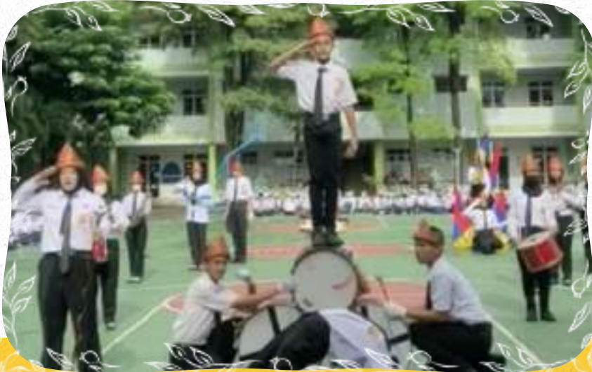
ATRAKSI DRUM BAND SMPN 6 UNGGUL SEKAYU DI PERAYAAN HUT KE 77 PGRI DAN HARI GURU NASIONAL TAHUN 2022