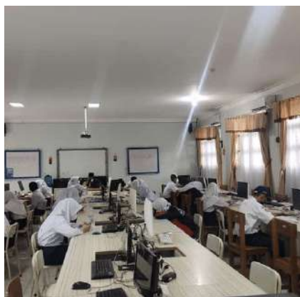
PAS DI RUANG MULTIMEDIA

#Buletin_Spenus, Sesuai dengan SK Kepala SMPN 6 Unggul Sekayu Nomor 421/716/SMP.6/2021 penjadwalan PAS Ganjil Tahun Pelajaran 2021/2022 dilaksanakan dari Senin (13/Desemembr/2021) hingga Jumat (17/Desember/2021) dan 2 mapel yang diuji setiap harinya