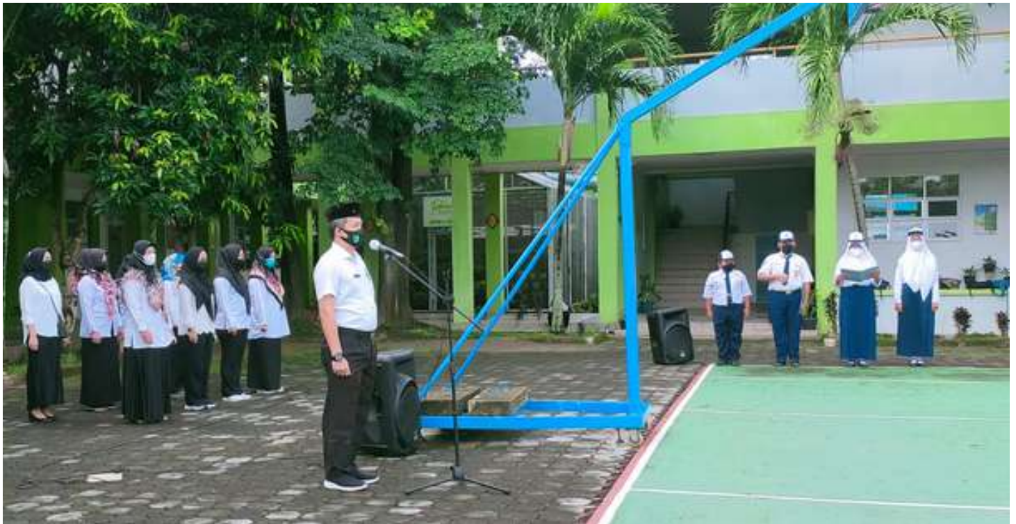
APEL PAGI SEBELUM PEMBELAJARAN