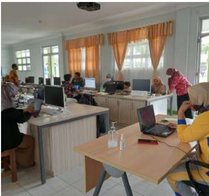
PROSES PENGISIAN E-RAPOR