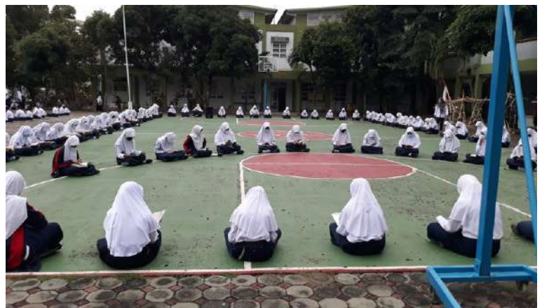
GERAKAN LITERASI SEKOLAH (GLS)