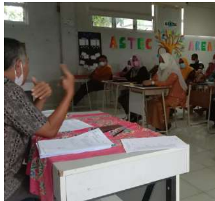
PEMBAGIAN RAPOR DAN PENGARAHAN KEPADA ORANGTUA