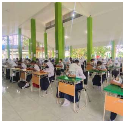
PAS DI AULA SPENUS

#Buletin_Spenus, Sesuai dengan SK Kepala SMPN 6 Unggul Sekayu Nomor 421/716/SMP.6/2021 penjadwalan PAS Ganjil Tahun Pelajaran 2021/2022 dilaksanakan dari Senin (13/Desemembr/2021) hingga Jumat (17/Desember/2021) dan 2 mapel yang diuji setiap harinya