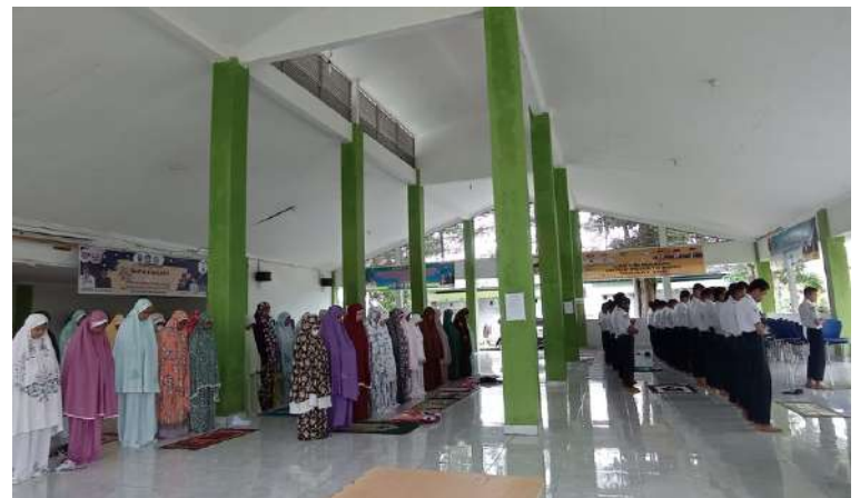
SHOLAT ZUHUR BERJEMAAH