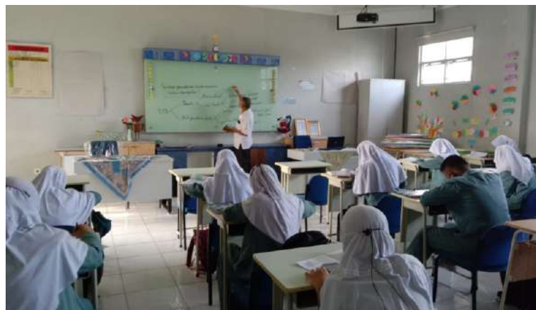
KEGIATAN TATAP MUKA DI KELAS